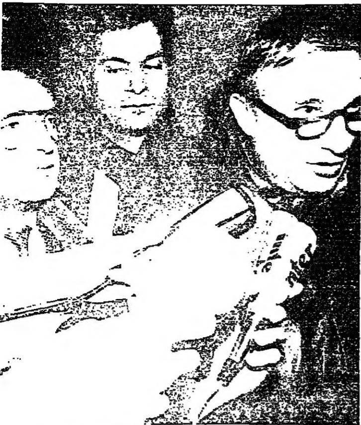
محمو عائلة لاروش يدلون بمطالعات متناقضة حول الجريمة